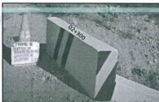
Imagen referencial N°03

Se pintará el parapeto de alcantarilla y aleros, según la imagen referencial.