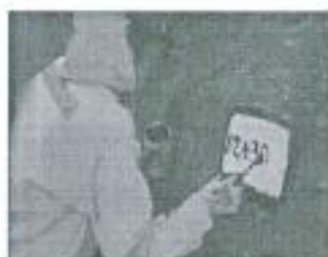
Imagen referencial N°01

Se pintará las progresivas de fondo color blanco, letras color negro, y escritura de la siguiente manera por ejemplo 02+300.