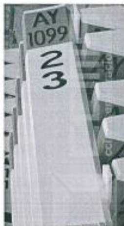
Imagen referencial N°02

Se pintará los hitos kilométricos de fondo color blanco, letras color negro y color cabezal naranja.