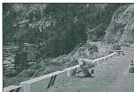
Imagen referencial N°03

Fondo blanco y líneas de color negro y amarillo, y progresiva de ubicación.