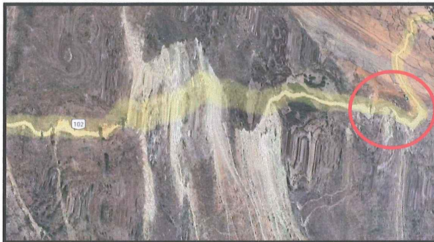
Lugar del proyecto.

El acceso a la localidad de Huacachi desde la ciudad de Huaraz, se encuentra descrita según el cuadro que a continuación se detalla: