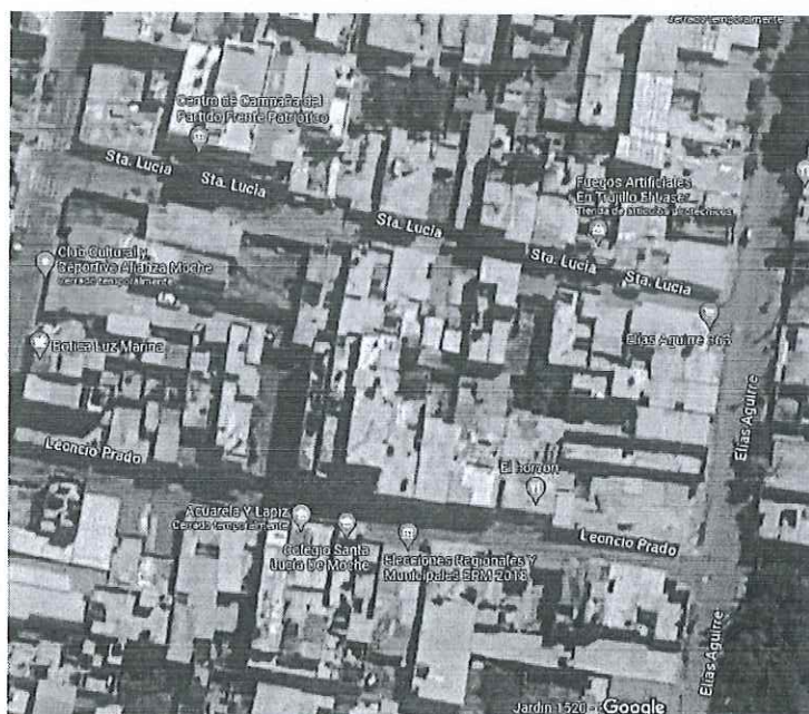
FIGURA N° 1 UBICACIÓN DEL PROYECTO

Localidad : Moche – Casco Urbano. Distrito : Moche Provincia : Trujillo Departamento : La Libertad