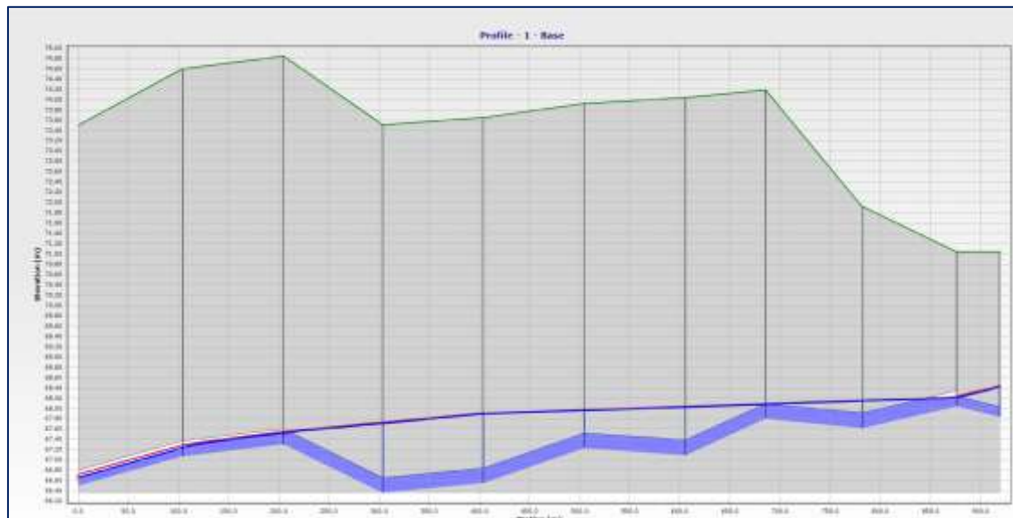
Imagen N° 1: Vista del funcionamiento actual del colector existente

al estado situacional en el Memorando N°0384 – 2023 – EPS GRAU S.A. – 430 alcanzado por la zonal Paita indica que las redes datan del año 1994 y que de acuerdo al mismo se requiere cambio de colector y subcolector.