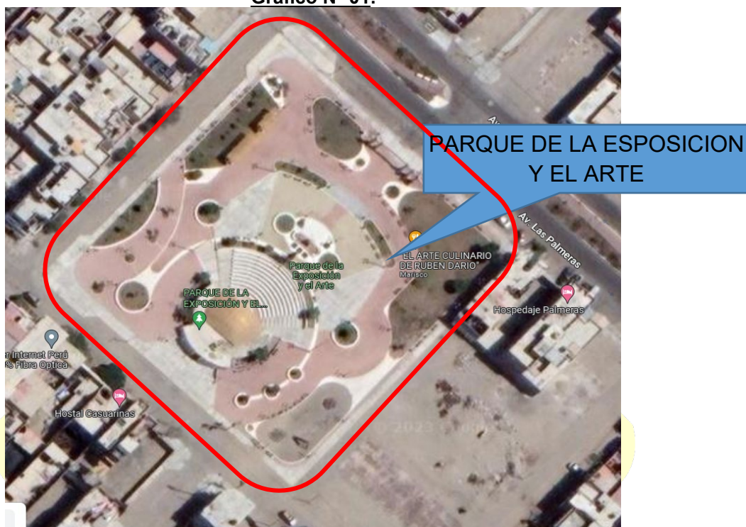
Gráfico N° 01:

Urb. Buenos Aires – Distrito de Nuevo Chimbote - Provincia de Santa.