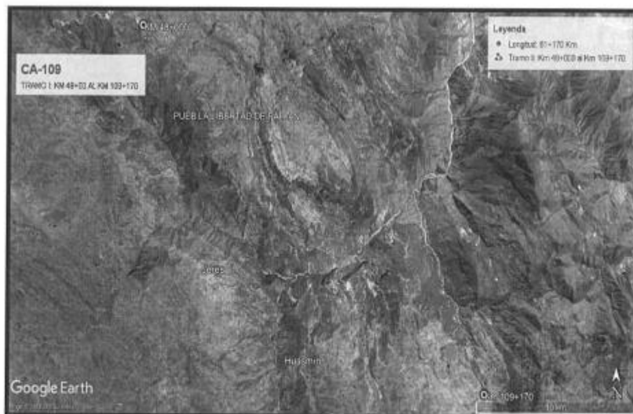
Ubicación de la Carretera CA-109 Tramo II: Km 48+000 al Km 109+170