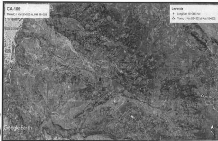
Ubicación de la Carretera CA-109 Tramo I: Km 00+000 al Km 16+000