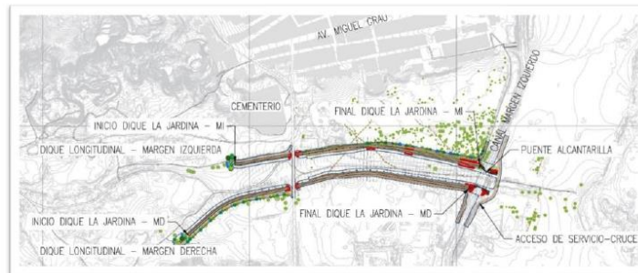
Plano de planta de diques longitudinales