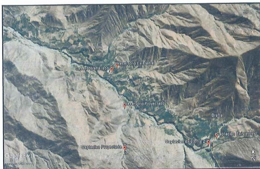
ESQUEMA DEL ÁREA DE ESTUDIO DEL PROYECTO