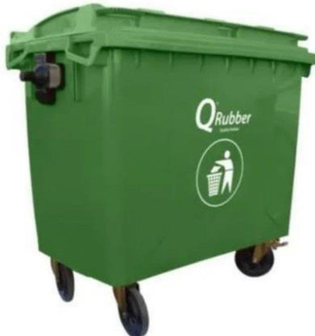
FOTO REFERENCIAL DEL CONTENEDOR DE BASURA