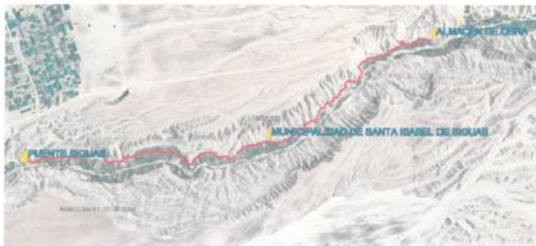
Plano de ubicación del almacén de obra