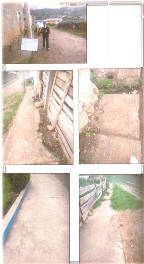
Veredas en mal estado.

Se presenta algunas vistas. Para mayor detalle ir al 2.11.9 plano de demoliciones y 2.11.10 plano de secciones registradas.