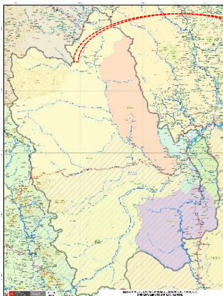
Ilustración N° 03: Mapa de la provincia de Moyobamba