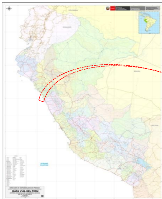
Ilustración N° 01: Mapa del Perú