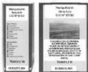
Figura N° 01