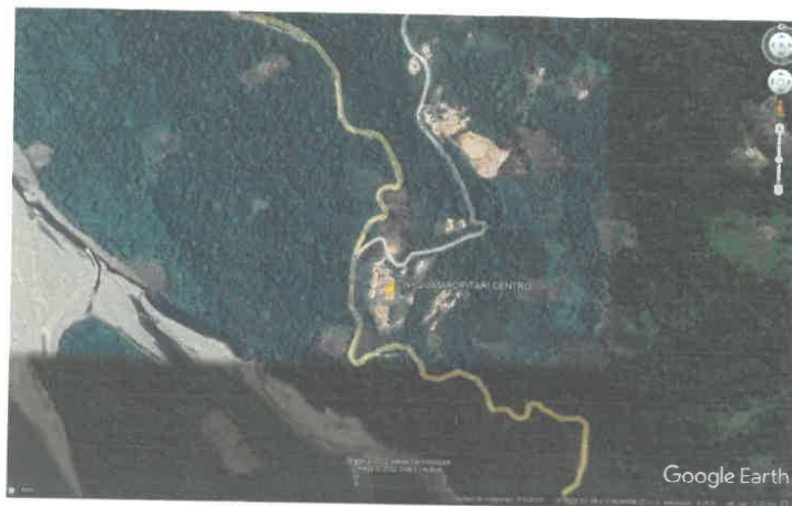
IMAGEN N°01: MAPA DE UBICACIÓN LOCAL