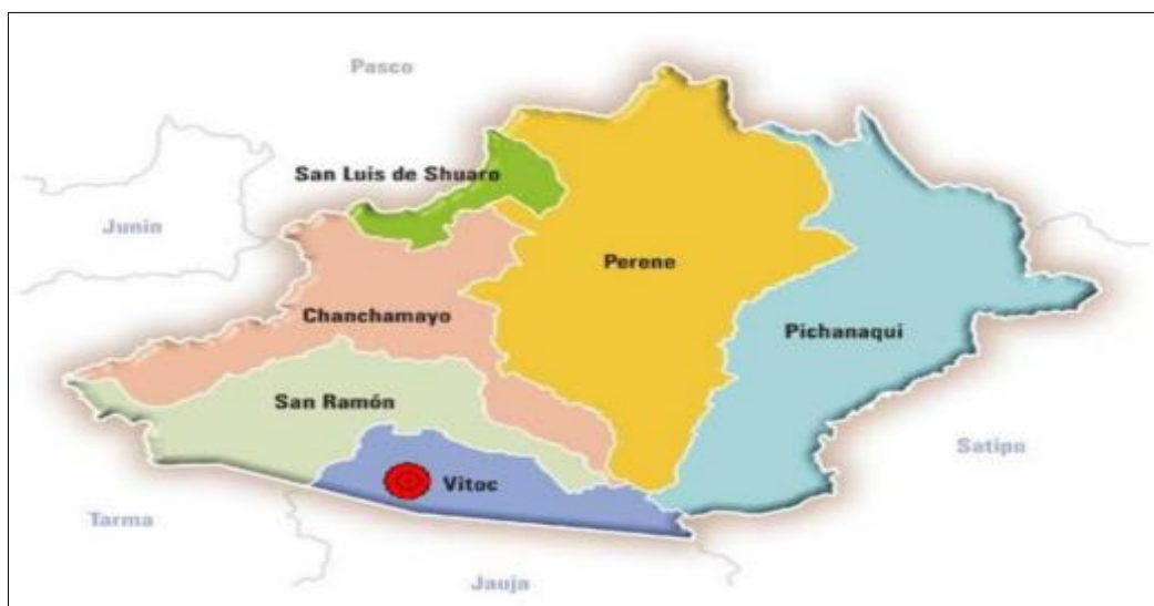
Imagen N° 01: Mapa del distrito de Vitoc con los límites.

Sector : Piedra Blanca Zona : Urbano – Rural Región Natural : Selva