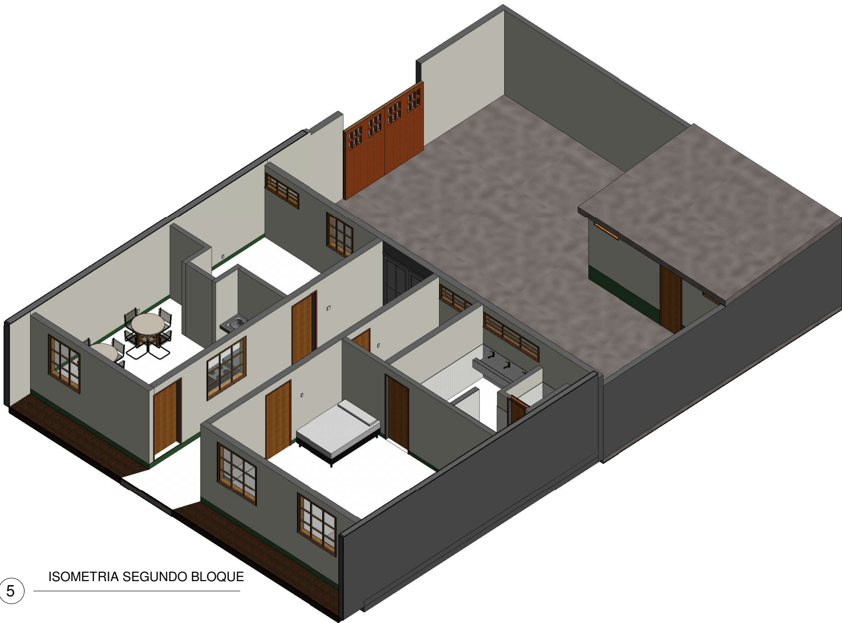
5 ISOMETRIA SEGUNDO BLOQUE