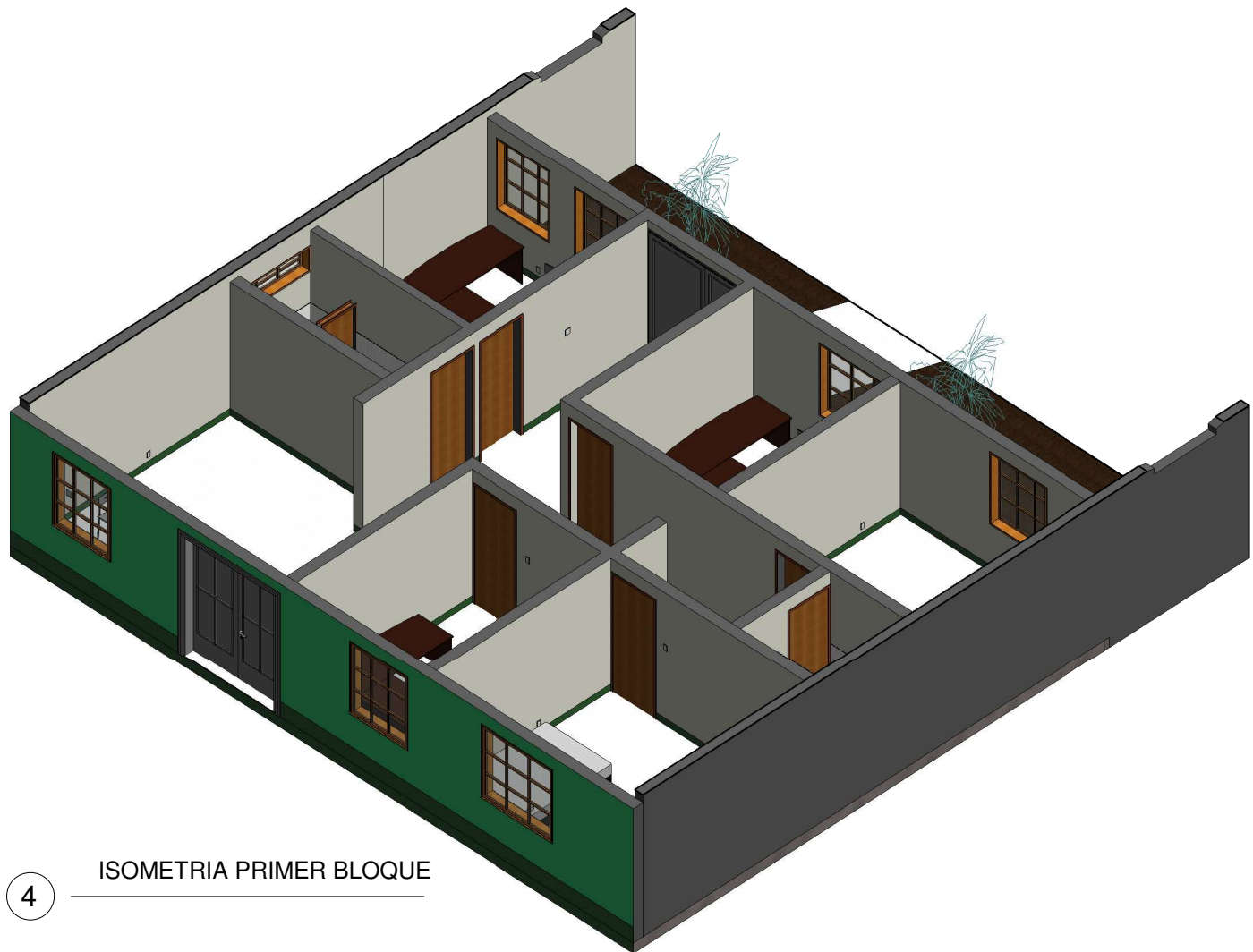
4 ISOMETRIA PRIMER BLOQUE