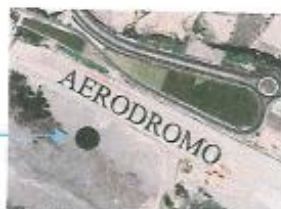
Figura 1 Ubicación del emplazamiento de obra (Punto Negro)