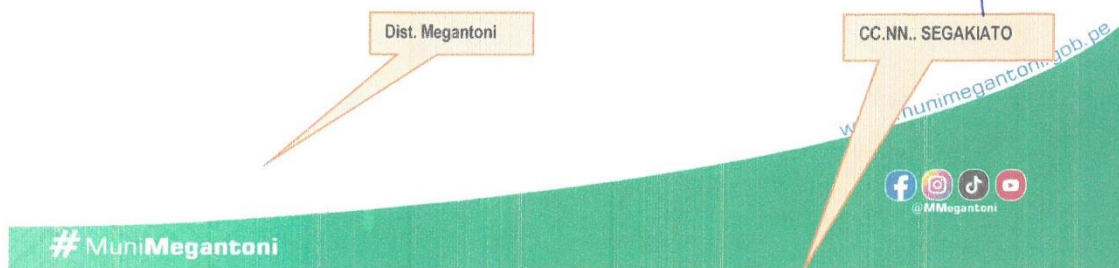
Mapa de Ubicación Comunidad Segakiato