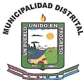
Logo de la Municipalidad Distrital de Sama