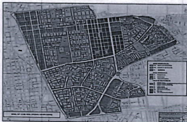
IMAGEN N° 02

"Año de la recuperación y consolidación de la economía peruana"