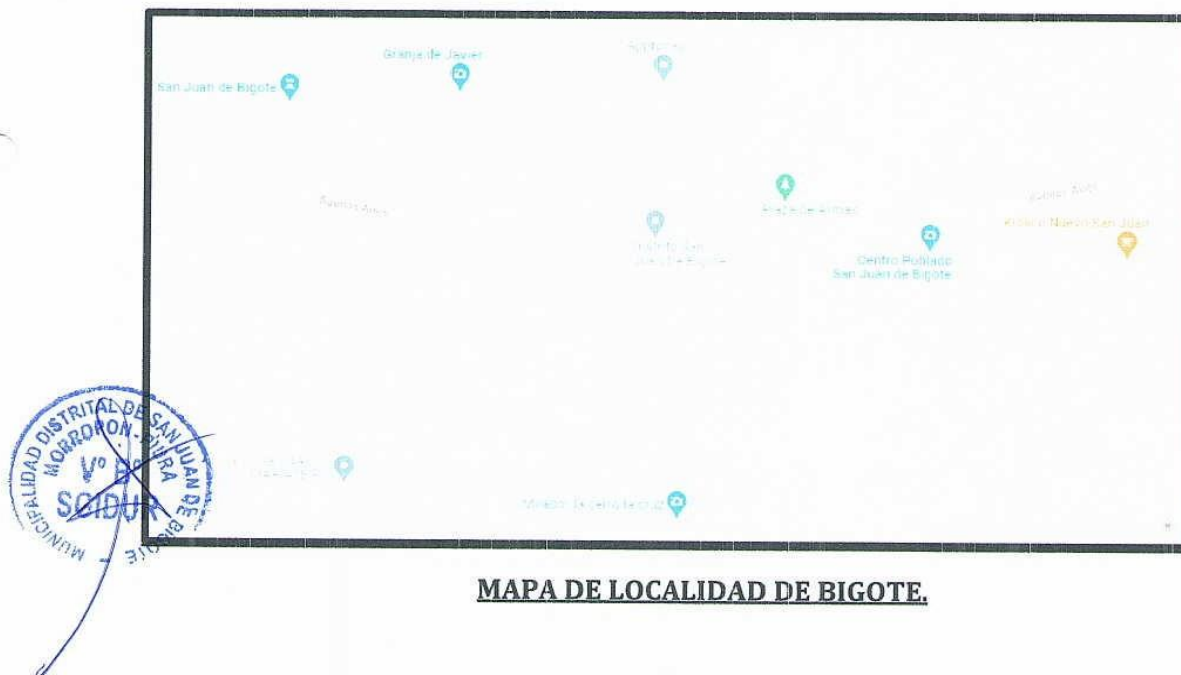
MAPA DE LOCALIDAD DE BIGOTE.

ACTIVIDAD: "ESTRUCTURAS DE MITIGACIÓN ANTE INTENSAS PRECIPITACIONES EN QUEBRADA NICO RIVAS DISTRITO DE SAN JUAN DE BIGOTE, PROVINCIA DE MORROPÓN, DEPARTAMENTO DE PIURA"