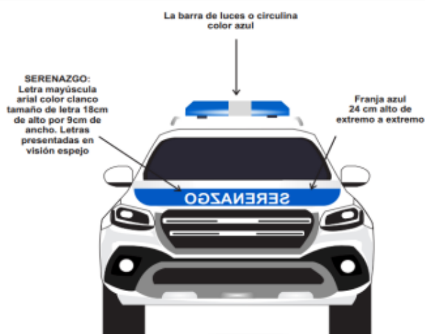
GRÁFICO N° 22 - POSTERIOR