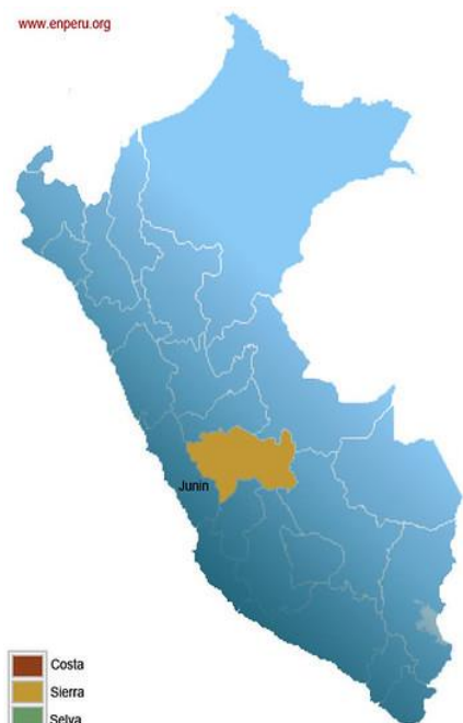
Mapa del Perú, ubicando región Junín Huancayo

El proyecto se encuentra ubicado en el área de influencia en el Distrito de Pilcomayo.