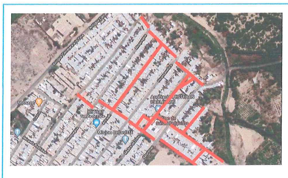
Gráfico 02: Localización del proyecto Elaboración propia