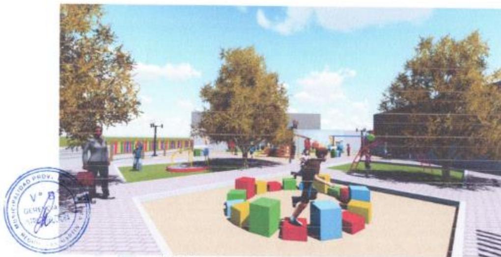
Imagen N° 04: Vista General del Mobiliario y equipamiento planteado