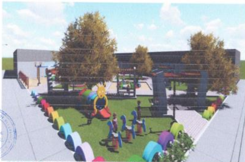
Imagen N° 02: Distribución tridimensional del mejoramiento del parque infantil.