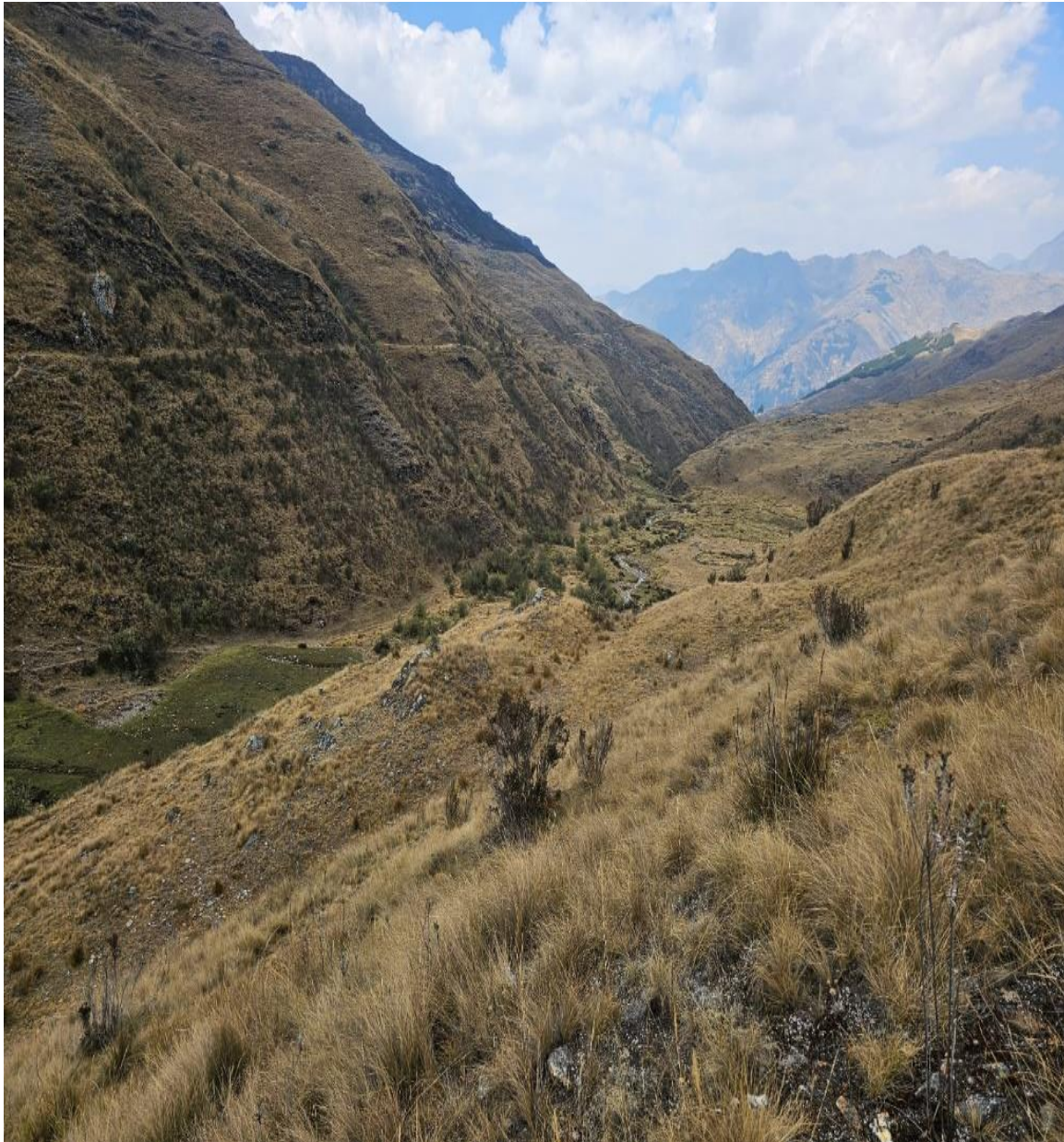
Vista fotografía del vaso Ojshapampa.

Por las razones antes expuestas y a fin de poder solucionar este problema que aqueja a los pobladores de la localidad en mención se plantea la creación de los servicios de riego.