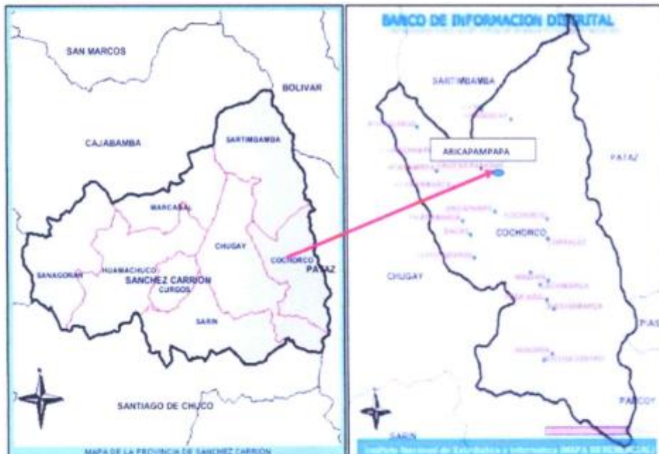
MAPA N°3. Ubicación de la zona del proyecto