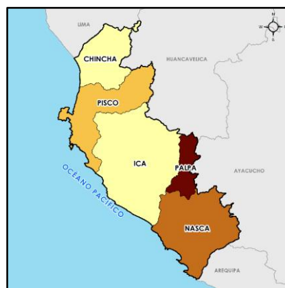
MAPA PROVINCIA DE ICA