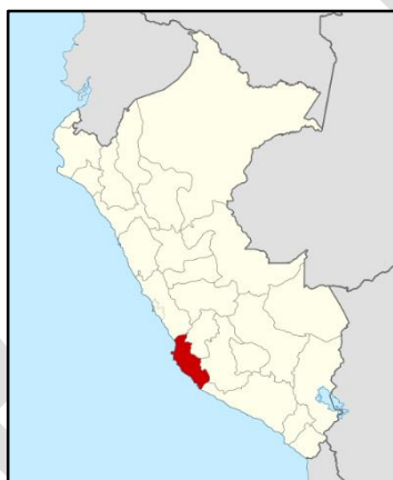
MAPA DEPARTAMENTO DE ICA