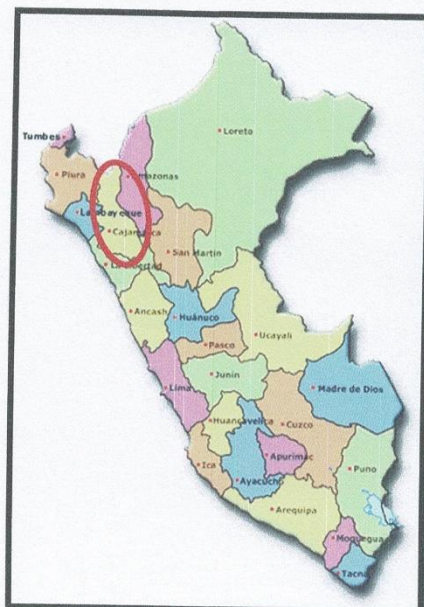
Gráfico N°01 – CAJAMARCA