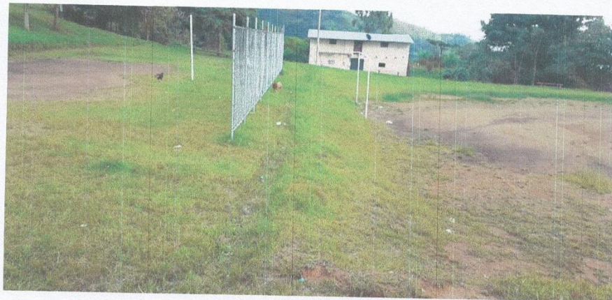
Fotografía N° 01. Vista del área destinada para el proyecto.

deporte en condiciones adecuadas, mejorando la imagen y calidad de vida de los pobladores.