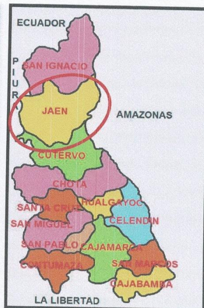
Gráfico N°02 - JAÉN