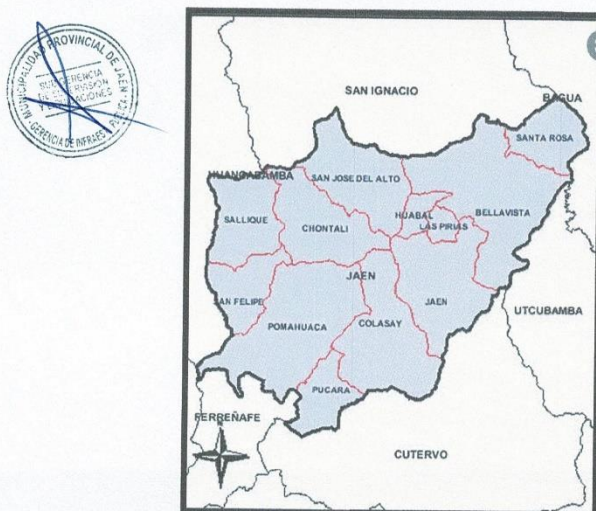
Gráfico N°03 – JAÉN