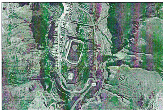
Ubicación del Estadio Municipal Castrovirreyna.

El centro educativo se encuentra ubicado en la Av. San Martín y Av. Los Libertadores S/N en el barrio de Chacapampa, del sector Yuracrumi en el distrito de Castrovirreyna, provincia de Castrovirreyna, departamento de Huancavelica.