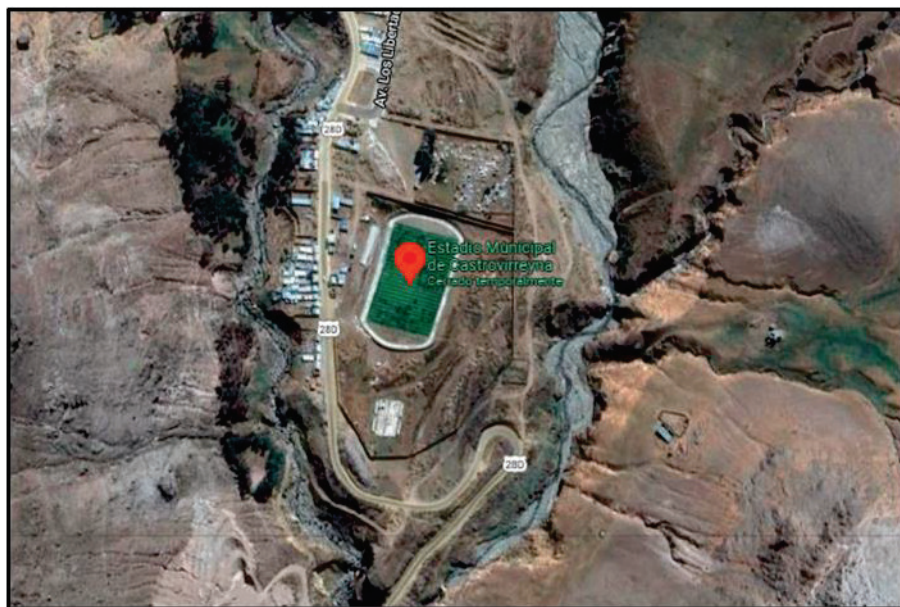
Ubicación del Estadio Municipal Castrovirreyna.

El centro educativo se encuentra ubicado en la Av. San Martín y Av. Los Libertadores S/N en el barrio de Chacapampa, del sector Yuraccrumi en el distrito de Castrovirreyna, provincia de Castrovirreyna, departamento de Huancavelica.