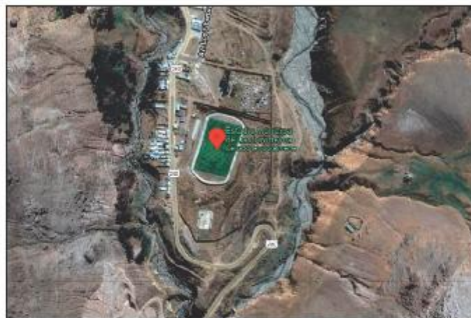
Ubicación del Estadio Municipal Castrovirreyna.

El centro educativo se encuentra ubicado en la Av. San Martín y Av. Los Libertadores S/N en el barrio de Chacapampa, del sector Yuracrumi en el distrito de Castrovirreyna, provincia de Castrovirreyna, departamento de Huancavelica.