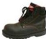
ZAPATO DE SEGURIDAD