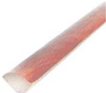
Rodón de madera aguano de \frac{3}{4} "

Se debe cumplir con lo establecido en el reglamento nacional de edificaciones y normas técnicas.