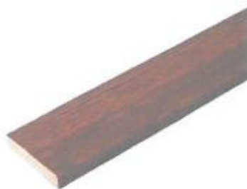
Contra zócalo de madera aguano de 3/4" X 4"