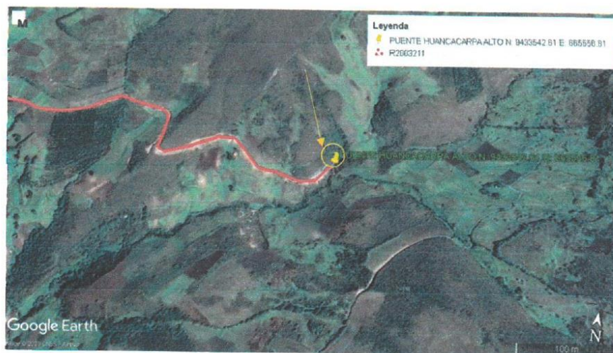
Figura N° 02.- Ubicación de la zona de intervención "Puente Huancacarpa Alto-Monte grande" en la localidad de Huancacarpa Alto, en el camino vecinal con código provisional R2003211, como lo indica la siguiente tabla

El área usuaria para el desarrollo de la siguiente contratación será la Jefatura de Obras y Maquinarias – Gerencia de Infraestructura Urbano y Rural de la Municipalidad Provincial de Huancabamba.