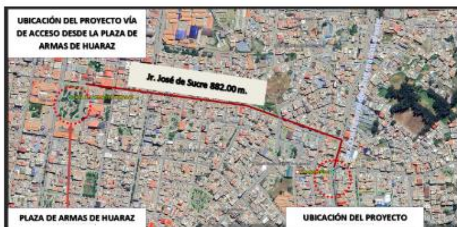
Gráfico: Accesibilidad desde Plaza de Armas de Huaraz a Ovalo Ayajamanam