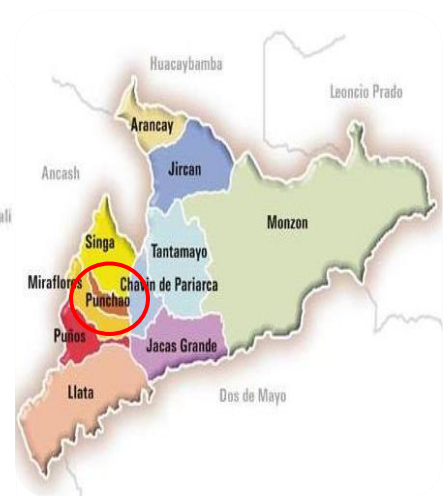
Ubicación en el ámbito distrital