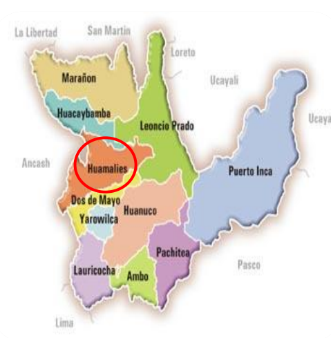
Ubicación en el ámbito provincial