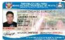
Carnet de Chofer - imagen 1