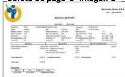
Boleta de pago 1 -imagen 1