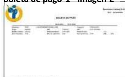
Boleta de pago 1 - imagen 2