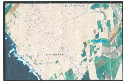
Vista Satelital del Proyecto