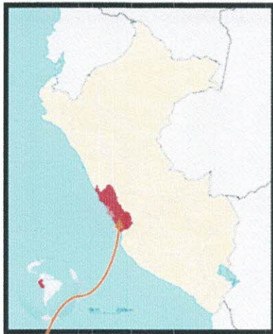
Ubicación Regional (Lima)