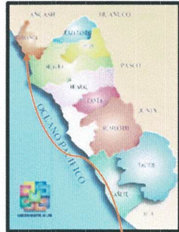
Ubicación provincial (Barranca)