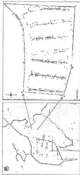
Imagen 2. Ubicación distrital y local (TOPOGRAFÍA Y GEODESIA - OCY, 2024)