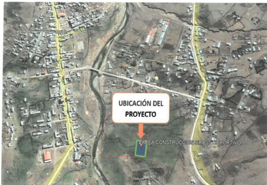
Ilustración 1. Ubicación del proyecto Deportivo en el Barrio Yurac Rumi

"Año de la Recuperación y de la consolidación de la economía peruana"