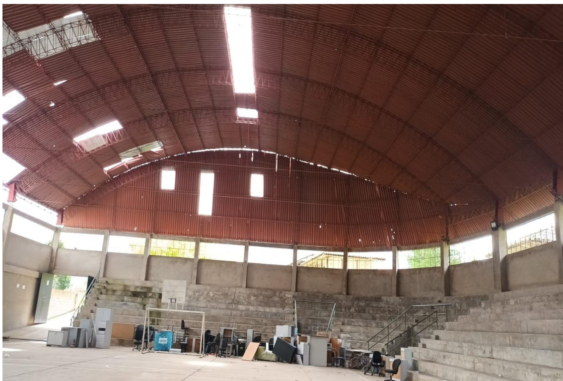
FOTOGRAFÍA 17: SE APRECIA DESPRENDIMIENTO DE CALAMINAS DE TECHO.