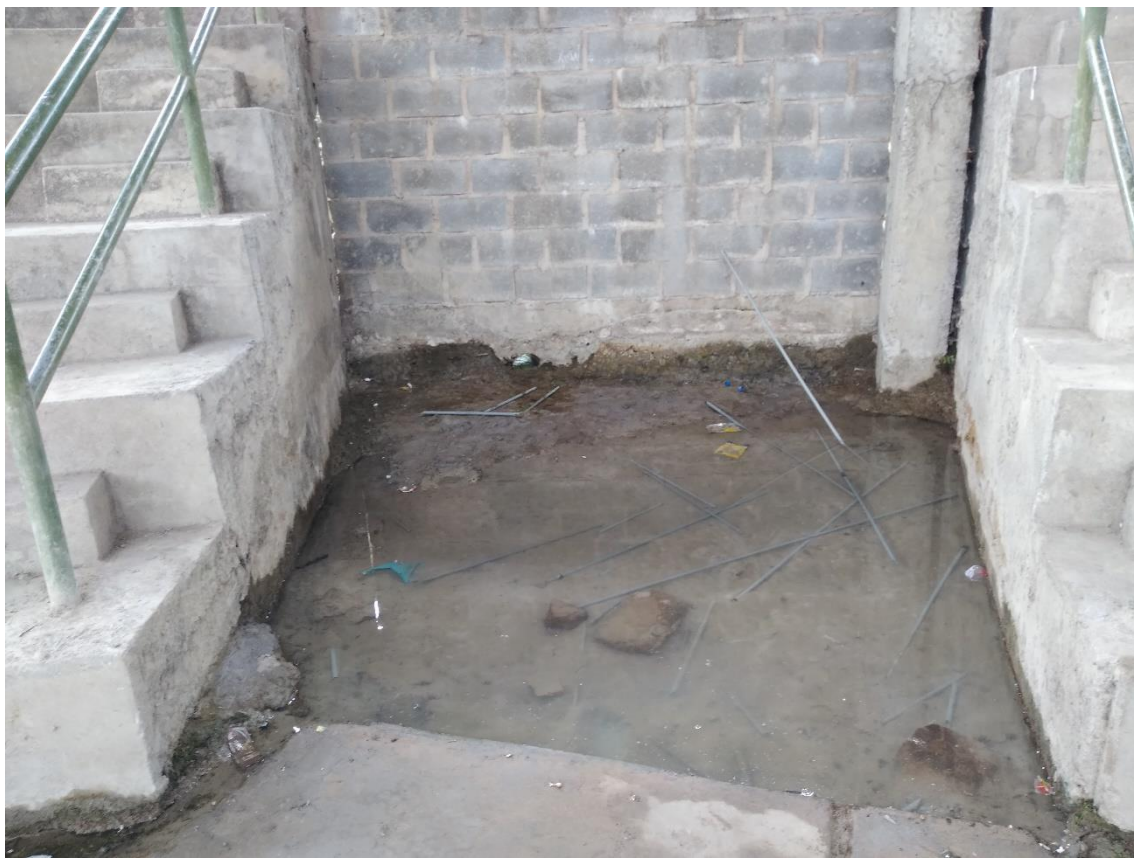
FOTOGRAFÍA 8: AGUA DEBAJO DE LAS GRADERÍAS DEBIDO AL INADECUADO SISTEMA DE DRENAJE PLUVIAL.