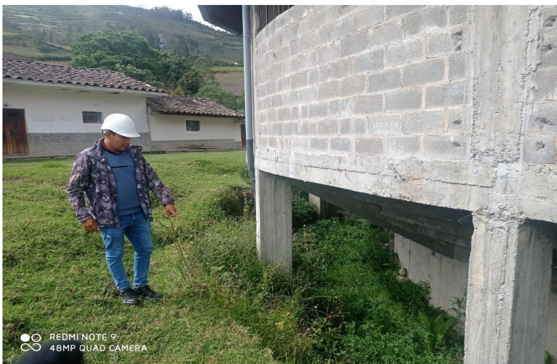
FOTOGRAFÍA 14: SE APRECIA ZONA DE DERRUMBE Y DONDE ES NECESARIO LA CONSTRUCCIÓN DE UN MURO DE CONTENCIÓN.