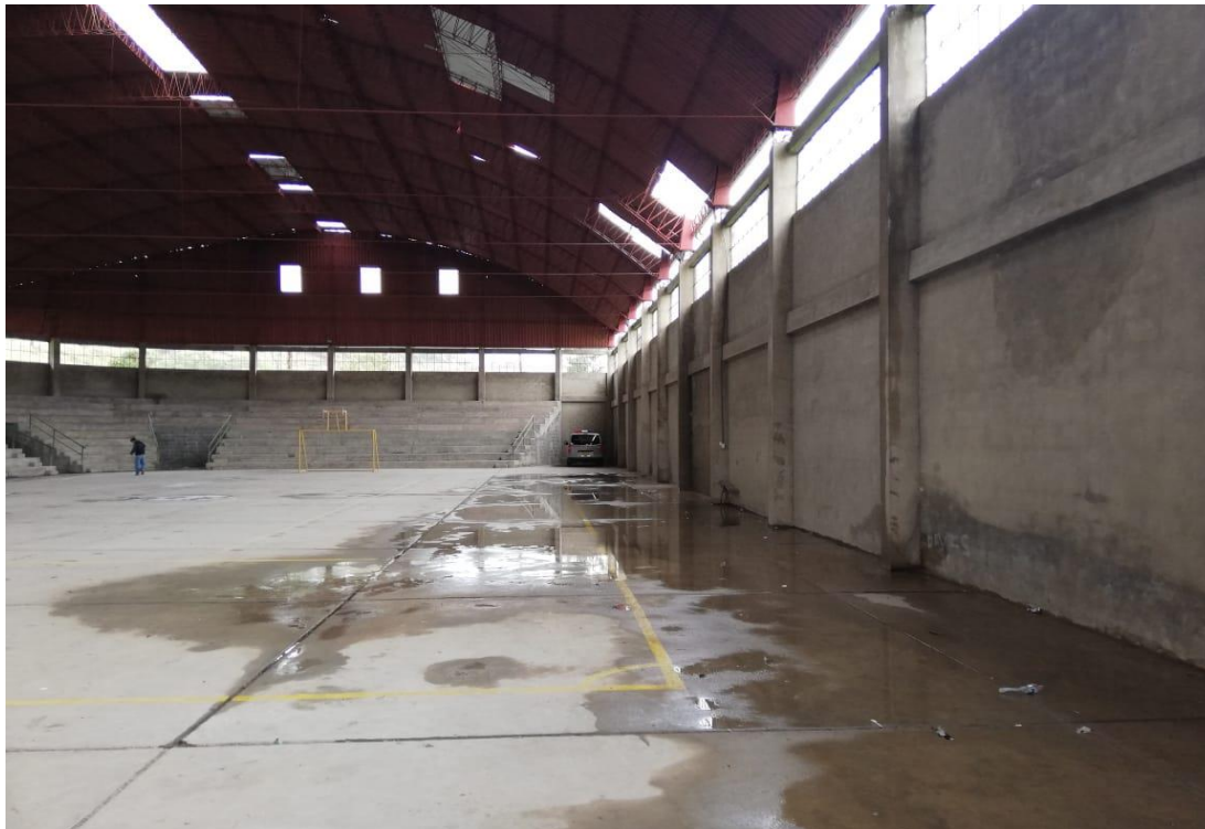
FOTOGRAFÍA 2: AGUA EMPOZADA EN EL INTERIOR DEL COLISEO, DEBIDO AL MAL ESTADO DEL SISTEMA DE DRENAJE PLUVIAL.