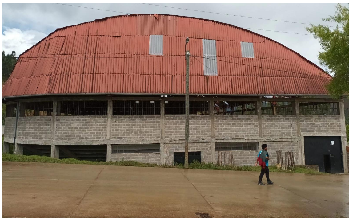
FOTOGRAFÍA 15: VISTA LATERAL DE TECHO, SE APRECIA MAL ESTADO DE LA COBERTURA.