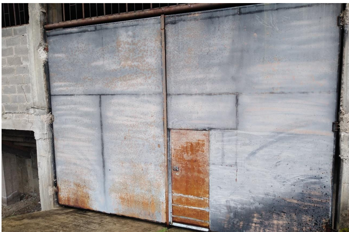
FOTOGRAFÍA 7: PUERTA METÁLICA PRINCIPAL DEL COLISEO EN MAL ESTADO.