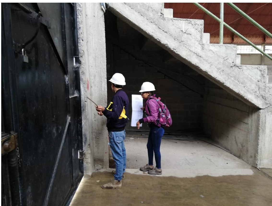
FOTOGRAFÍA 10: ESPECIALISTAS DURANTE LA VISITA, REALIZANDO LA VERIFICACIÓN.