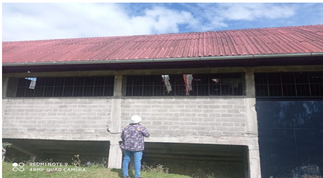
FOTOGRAFÍA 11: ING. PROYECTISTA REALIZANDO UN ANÁLISIS PREVIO VISUALMENTE