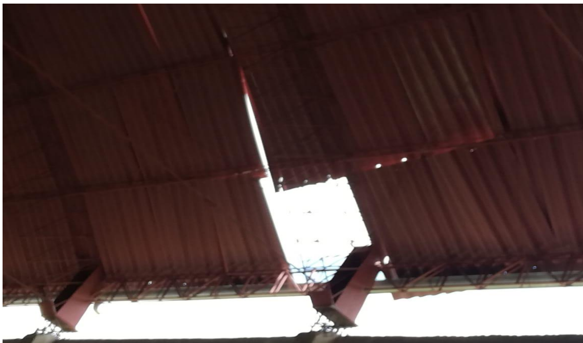
FOTOGRAFÍA 1: EN LA IMAGEN SE OBSERVA EL DESPRENDIMIENTO DE LA COBERTURA DEL TECHO DEL COLISEO CERRADO DE DURAZNOPAMPA, EL CUAL SERÁ REPUESTA CON COBERTURA 4GR 0,40MM CURVO ALUZINC PREPINTADO AZ150.