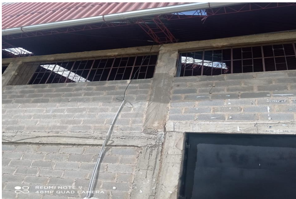
FOTOGRAFÍA 12: SE APRECIA INSTALACIONES ELÉCTRICAS A LA INTEMPERIE.