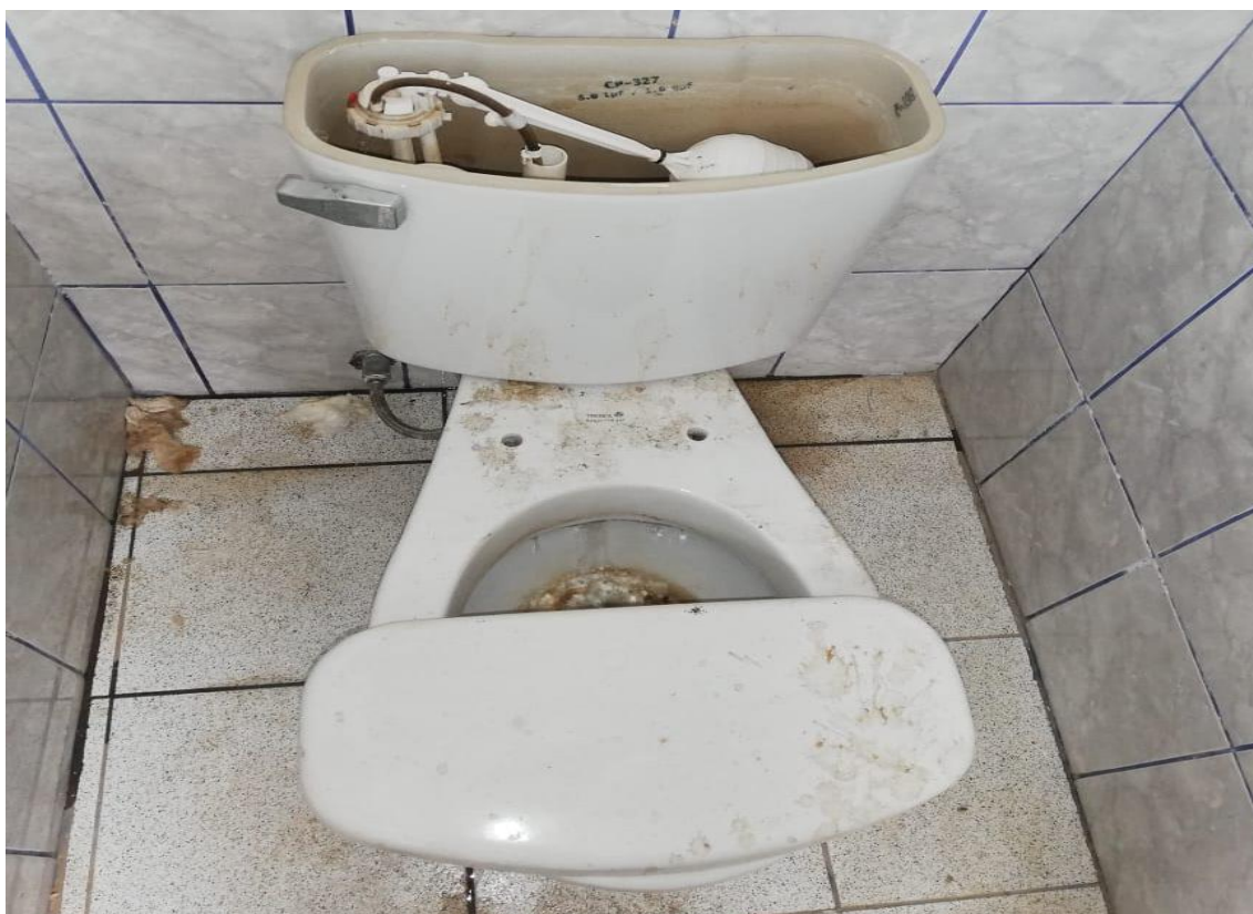
FOTOGRAFÍA 3: SERVICIOS HIGIÉNICOS EN PÉSIMAS CONDICIONES, EL CUAL SERÁ REPUESTO POR UN NUEVO INODORO.