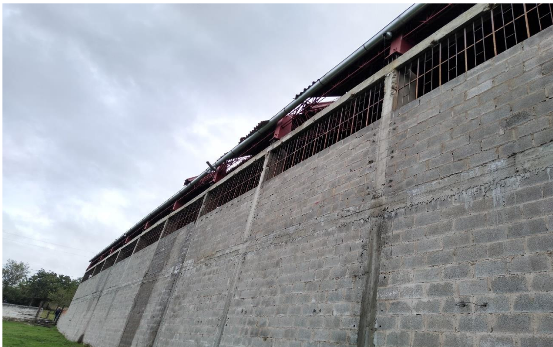
FOTOGRAFÍA 6: ES OBSERVA QUE LA CANALETA DE DRENAJE PLUVIAL CON DEFICIENTE DIÁMETRO, POR LO CUAL NO ESTA CUMPLIENDO SU FUNCIÓN. ASIMISMO, SE PUEDE APRECIAR LA CORROSIÓN DE LAS VENTANAS METÁLICAS.