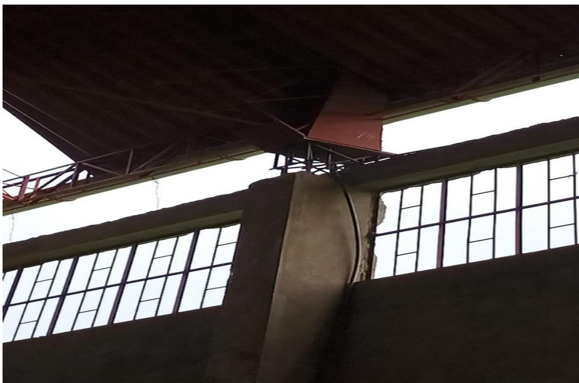
FOTOGRAFÍA 16: SE APRECIA FALTA DE COLOCADO DE CONCRETO EN UNIÓN DE COLUMNA Y VIGA CIRCULAR DE TECHO.