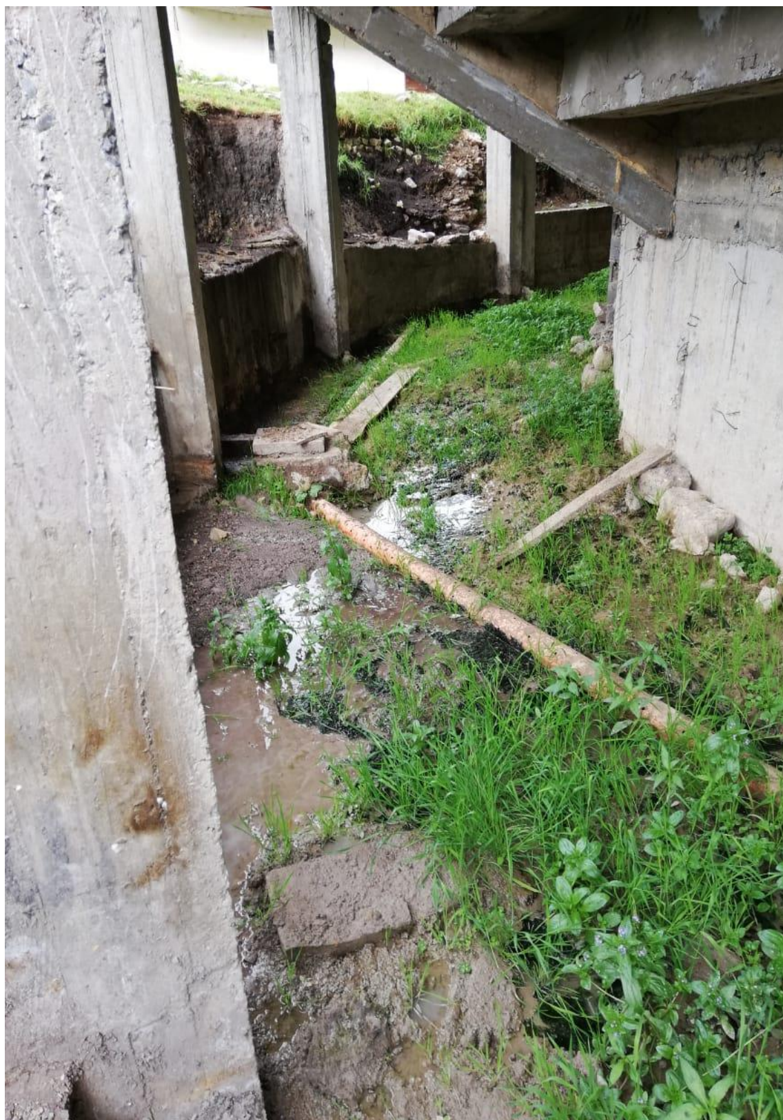
FOTOGRAFÍA 5: TUBERÍA DEL SISTEMA DE DRENAJE A LA INTEMPERIE Y OBSTRUIDO, EL CUAL NO ESTA CUMPLIENDO SU FUNCIÓN.