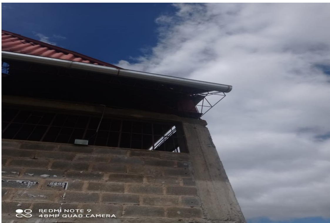
FOTOGRAFÍA 13: SE APRECIA VIGA EN VOLADIZO DE ACERO CORRUGADO.