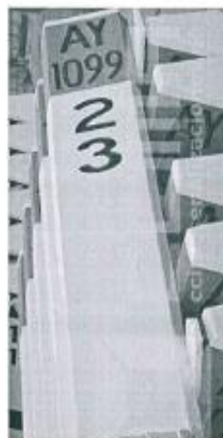
Imagen referencial N°02

Se pintará las progresivas de fondo color blanco, letras color negro, y escritura de la siguiente manera por ejemplo 02+300.