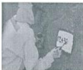
Imagen referencial N°01

Se pintará las progresivas de fondo color blanco, letras color negro, y escritura de la siguiente manera por ejemplo 02+300.