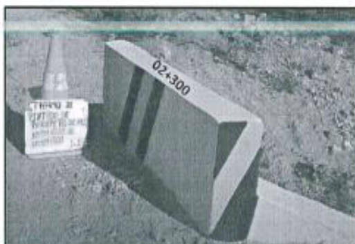
Imagen referencial N°03

Se pintará el parapeto de alcantarilla y aleros, según la imagen referencial.