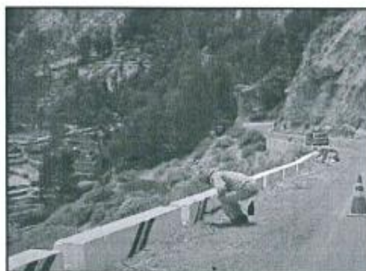
Imagen referencial N°04

Fondo blanco y líneas de color negro y amarillo, y progresiva de ubicación.