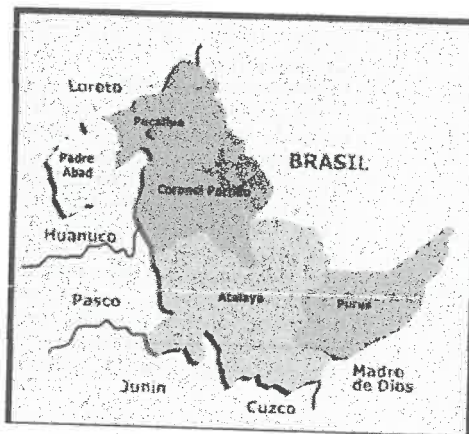
Imagen N°02: Mapa de macro localización del Departamento de Ucayali