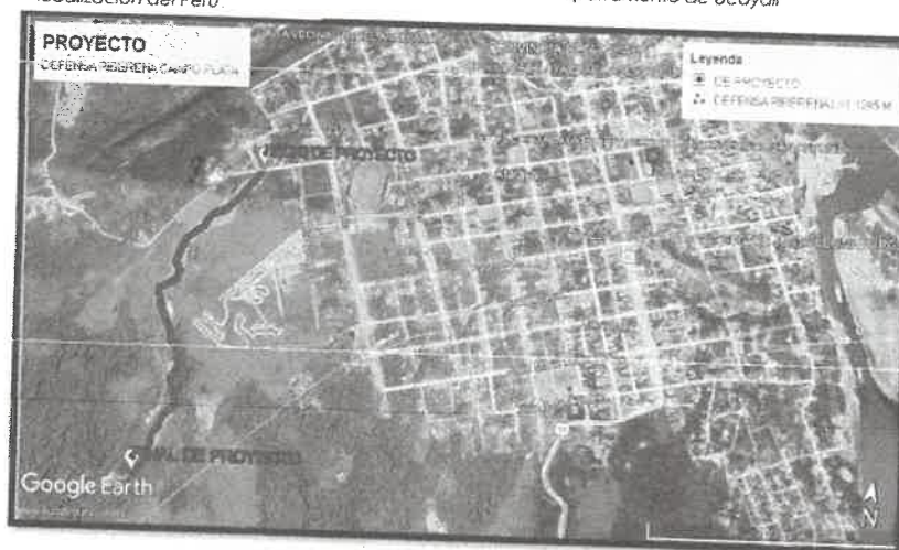
Imagen N°03: Mapa de micro localización del terreno para el proyecto con el Centro de la Ciudad.

La Municipalidad Provincial de Atalaya facilitará la siguiente información: