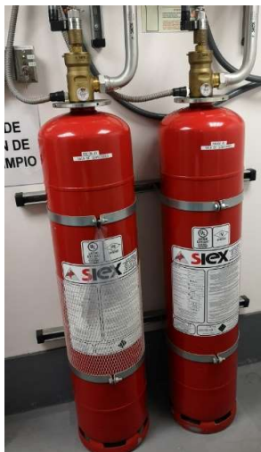
Imagen de los cilindros ubicados en Sala Eléctrica.

Imagen de los cilindros ubicados en Salas de Monitoreo y Servidores.