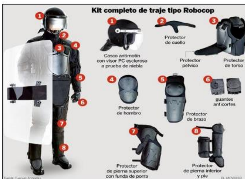
Imagen referencia- ítem N° 1 e ítem N° 2

Firma digital MUNICIPALIDAD DE LIMA Firmado digitalmente por KULJEVAN GARCIA Mirko Jorge Enrique FAU 20131380951 soft Motivo: Day V° B° Fecha: 27.09.2023 17:54:47 -05:00