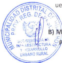
Distrito de Huachón