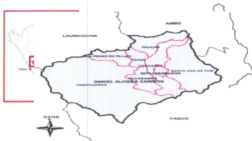
FIGURA N° 1 UBICACIÓN DEL PROYECTO

ALCANCES DEL EXPEDIENTE TÉCNICO DE IOARR DEL PROYECTO: "REPARACION DE SUPERFICIE DE RODADURA Y CUNETAS; EN EL (LA) TRAMO LOCALIDAD DE PIQUILHUANCA (00+000 KM)-LOCALIDAD DE TACTAYOC (10+900 KM) DISTRITO DE SANTA ANA DE TUSI, PROVINCIA DANIEL ALCIDES CARRION, DEPARTAMENTO PASCO" CUI N°2613503