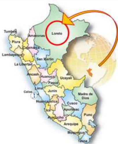
Gráfico N° 2:

Mapa de Macro Localización de la Región Loreto.