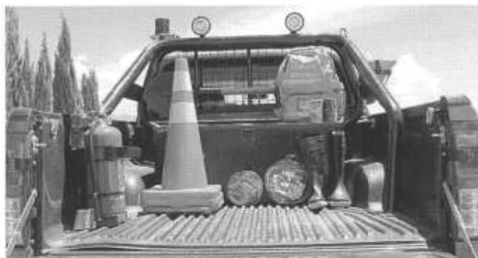
Imagen referencia con antivuelvo bajo tolva