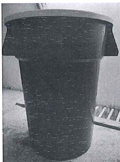
TACHO POLIETILENO TAPA REMOVIBLE DE 150 A 160 LITROS APROXIMADAMENTE

EL CONTRATISTA DEBERÁ ENTREGAR PRODUCTOS DE BUENA CALIDAD Y GARANTÍA (PREVIA COORDINACIÓN CON EL ÁREA USUARIA).