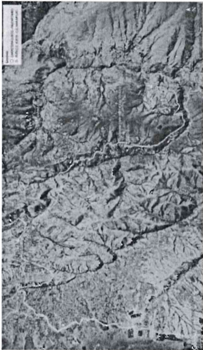
IMAGEN N° 01: CROQUIS RUTA DESVÍO CARRETERA CUSCO-PAUCARTAMBO – DISTRITO COLQUEPATA

NOTA: para tener mayor referencia de la ubicación de entrega del bien, se muestra la imagen N° 01.